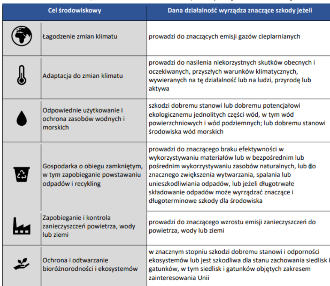
Tabela 1 Znaczące szkody dla 6 celów środowiskowych wg rozporządzenia w sprawie taksonomii